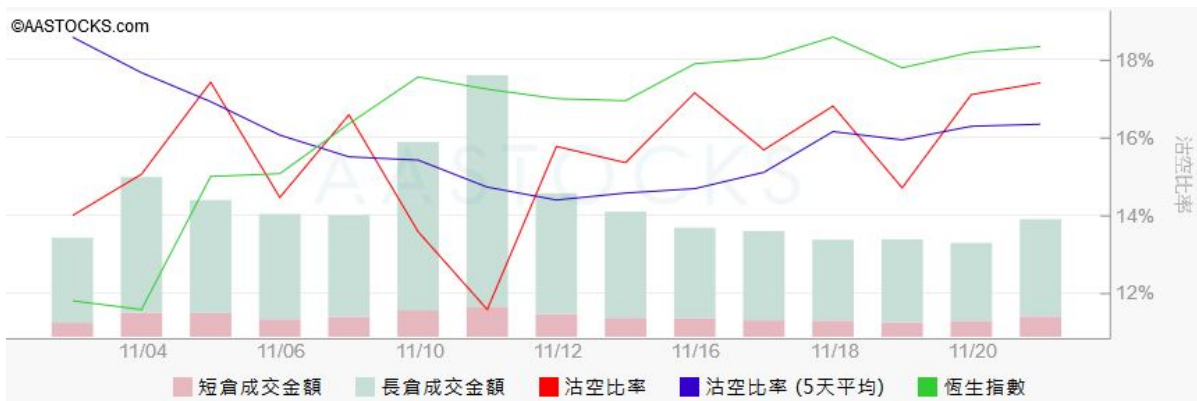
图3. aastock: 恒指沽空比率