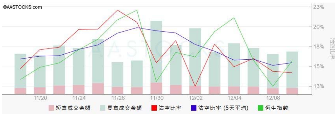
圖3. aastock: 恒指沽空比率