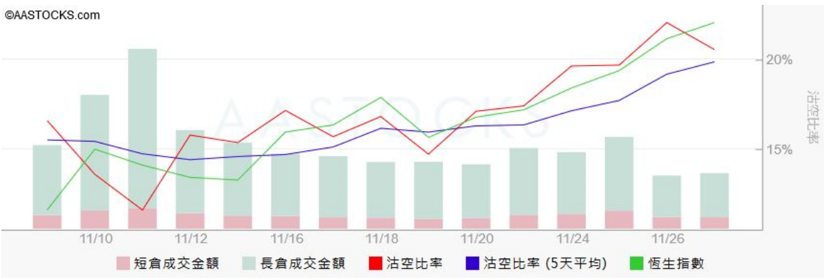
图3. aastock: 恒指沽空比率