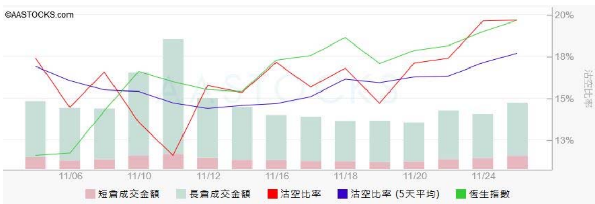
圖3. aastock: 恒指沽空比率