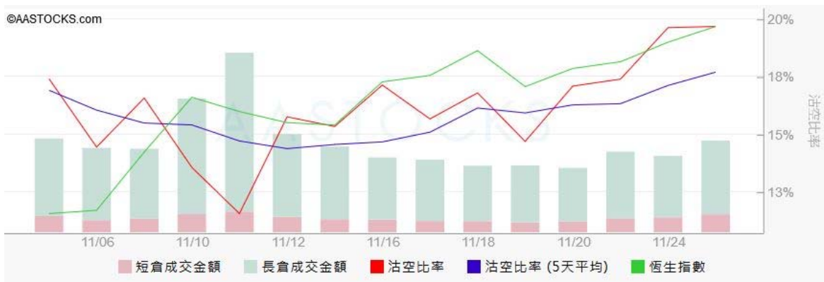
图3. aastock: 恒指沽空比率