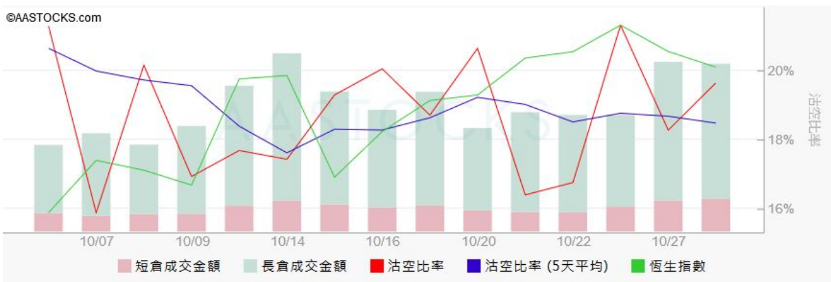
圖3. aastock: 恒指沽空比率