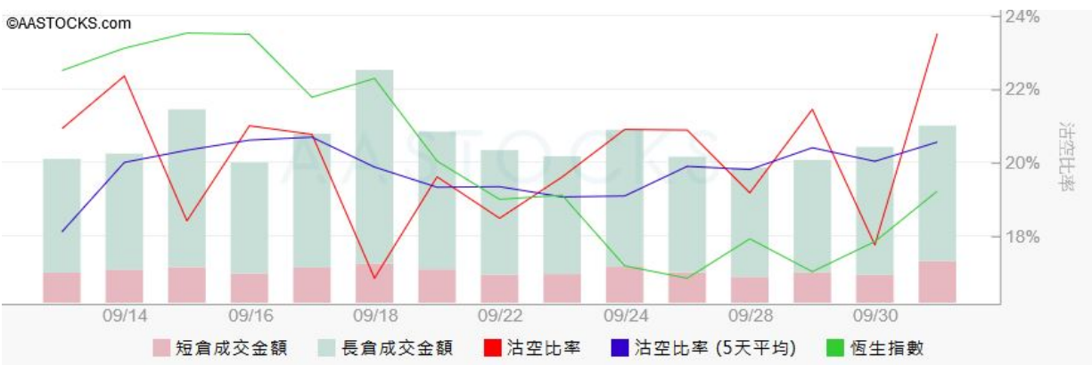
圖3. aastock: 恒指沽空比率