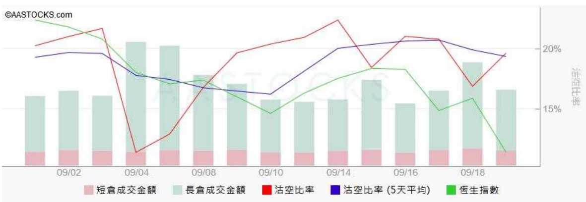
图3. aastock: 恒指沽空比率