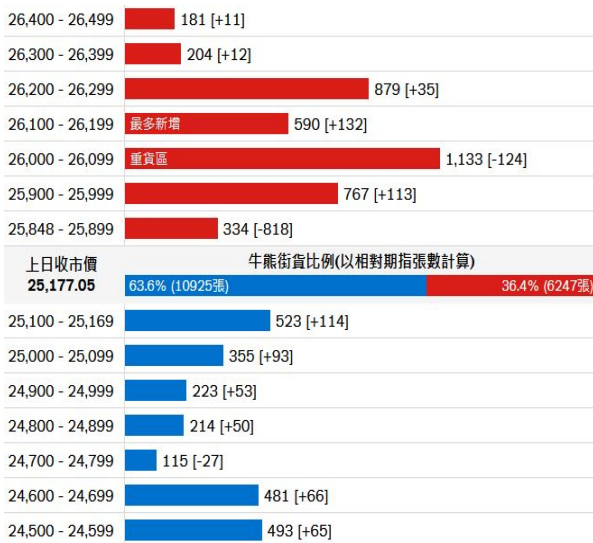
圖2. 瑞信: 牛熊證街貨比例及分佈